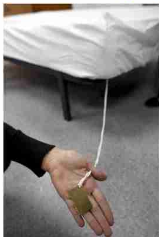
Presentación de las sábanas con efecto anti-estrés, que incorporan un tejido para eliminar las cargas electrostáticas acumuladas en el cuerpo, hoy en Valencia.

Otro estudio realizado a individuos con problemas crónicos de espalda y articulaciones puso de manifiesto que se consiguió una relajación muscular y una disminución del dolor tanto en espalda como en articulaciones en el 60% de los casos estudiados, según Aitex.