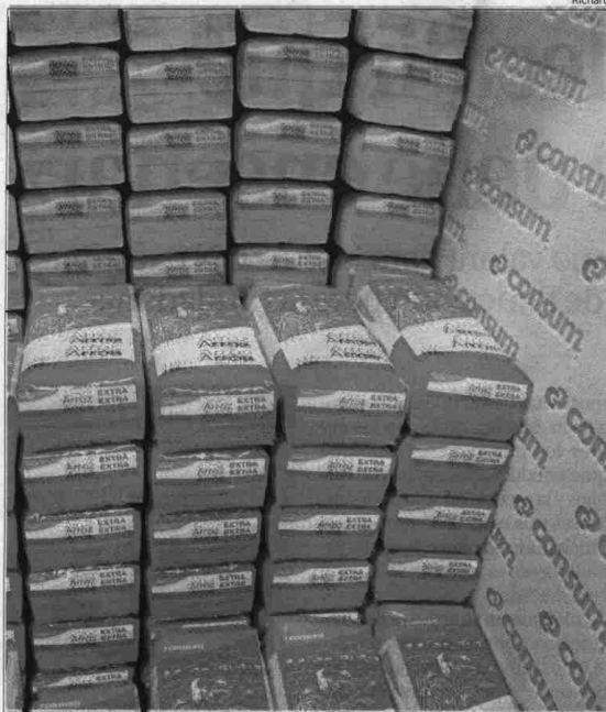
Las ventas de producto propio han aumentado estos tres últimos meses

VALENCIA- En situaciones de crisis lo primero que se resiente es el consumo. Los bolsillos de los consumidores no están para caprichos ni lujos como demuestra la tendencia hacia las marcas blancas, aquellas que se comercializan con el nombre de la empresa distribuidora y significativamente más baratas que aquellas de renombre. Así lo constata una de las principales cadenas de supermercados de la Comunitat Valenciana. Las más de 500 tiendas que conforman la red de Consum han visto cómo, en los últimos tres meses, el consumidor ha dejado de comprar artículos de marca para decantarse por los de logo propio. Los datos que avalan esta percepción son que el trece por ciento de las ventas totales de esta compañía corresponden a marcas propias, y si en 2007, las ventas totales experimentaron un incremento del 34 por ciento respecto al año anterior, las del segmento menos caro lo hicieron un cuarenta por ciento. Sin embargo, matizó que el incremento del precio de los alimentos no es tan exagerado como se está haciendo creer. «Es una información segmentada. Nadie dice que, por ejemplo la fruta es más barata ahora o que el precio del pescado ha descendido un diez por ciento», según explicó ayer el director ge-