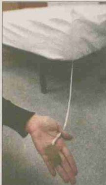
El tejido, en una prueba.

Este tejido funcional, registrado con la marca Zazen, es capaz de neutralizar la corriente inmóvil generada durante el día por el rozamiento entre el cuerpo y la ropa, así como por la influencia de los campos generados por teléfonos móviles, ordenador, televisión, electrodomésticos... El estrés, la fatiga mental y el cansancio corporal son algunas de las