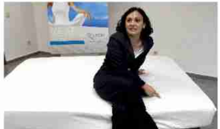
Presentación de las sábanas con efecto anti-estrés, que incorporan un tejido para eliminar las cargas electroestáticas acumuladas en el cuerpo, hoy en Valencia.

La empresa textil valenciana Aznar Textil y el Instituto Tecnológico Textil Aitex han presentado hoy una sábana bajera anti-estrés que libera la electricidad estática y favorece el descanso y que es la culminación de un proyecto de investigación de varios años.